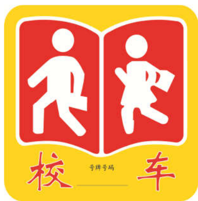
图 4a) 校车标牌正面式样 图 4b) 校车标牌背面式样

四、第 5.2.2.1 条修改为：校车前风窗玻璃右下角放置的校车标牌外廓尺寸为 300mm×300mm，其他尺寸见图 5。校车标牌正面中文字符“校车”字